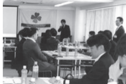
各者のトップが集まってグループで話し合い

総務省の統計調査 高齢者24・1%に 総務省統計局がわが国の65歳以上の高齢者数を発表しました。それによると2012年9月15日現在、65歳以上の高齢者は3074万人で総人口に占める割合は24・1%に達しました。不動産業界でも高齢者住宅に関する入居環境について多くの議論が行われ、また新ビジネスへの対応も進んでいます。