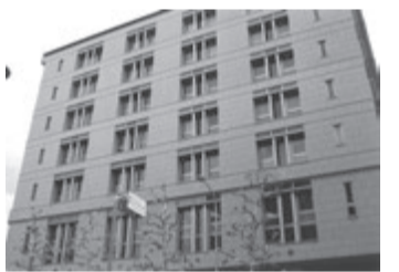
会場の「ハートピア京都」

明。賃貸住宅のレベルが向上し、供給にはさらに工夫の余地は十分あると感じさせるもので、オーナーには「やる気」を起こさせる内容でした。