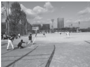
熱戦を展開(皇子山総合運動公園)

大会は大会史上最多の16チーム(大阪支部4チーム、京都府支部6チーム、奈良県支部2チーム、滋賀県支部4チーム)、約200選手が出場。決勝戦は、tk tj ジャイアンツ(京都、宅都ホールディングス)とキングオブキングスB(京都、長栄)が対戦、11対5でキングオブキングスBが優勝しました。tk tj ジャイアンツが準優勝。3位は奈良日化サービス。絶好の好天に恵まれ、参加者はスポーツの秋を満喫していました。