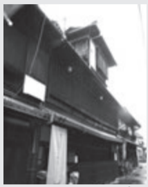
貸し出された町家(大和郡山市)

奈良県内の町家を期間限定で貸し出す「大和・町家サプリースプロジェクト」(国土交通省委託事業)が10月20日から11月18日まで大和郡山市など4市6軒の町家で行われ、服飾販