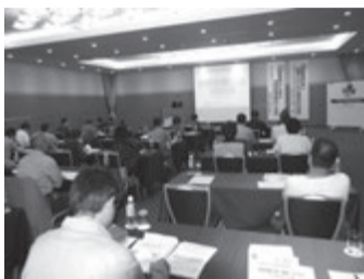
和歌山県支部オーナーセミナー

和歌山県支部のオーナーセミナーは14日、和歌山市のダイワロイネットホテル和歌山で約50人が参加して開催。