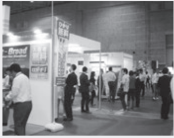
賑わうフェア会場2万人近くが来場

10月11日と12日の2日間、大阪府支部のブースは来場者が知りたい勉強したいことを賑わうフェア会場2万人近くが来場