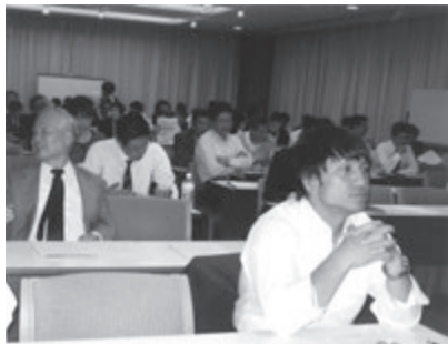
賃貸住宅経営者やオーナーが集まり、熱心に話を聞いていました