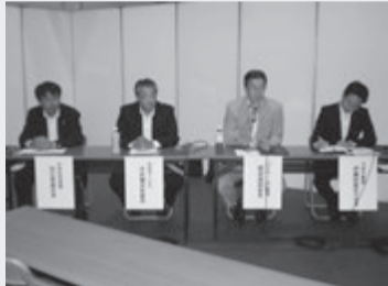
パネリストがざらり並んで来場者と交歓一つ一つの質問に丁寧に答えていました