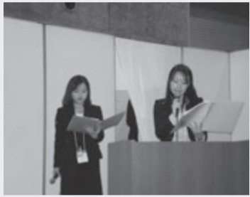
リフォームをテーマにレディース部会員が活躍

10月11日と12日の2日間、大阪府支部のブースは来場者が知りたい勉強したいことを賑わうフェア会場2万人近くが来場