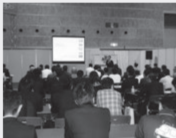
人が集まった大阪府支部の研修会場

と急傾斜していく現実を知る場所であったこと。ニーズの多様化へ対応出来る賃貸業務のスペシャリストがますます必要になってきたこと。さらには官民一体での入居環境向上への努力が大切なことを知りました。