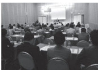
満員になった奈良県支部オーナーセミナー

り、地域の活力低下を招いています。そこで町家の価値と魅力を再発見するのがプロジェクトの狙いです。奈良県内の賃貸住宅新築数は減少傾向。管理業者にとっても町家の活用が重要課題。日管協は町家の賃貸契約書づくりなどに協力しています。