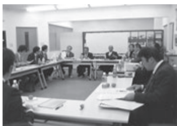
近畿ブロックの会合では登録件数を発表

その状況下で賃貸住宅入居者から契約を主にした苦情相談の多いのも事実。そこで、市場の安定を図り、安心して経営や住宅供給を目指すために国が主導して「登録制度」を発足させたのです。