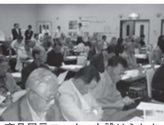
商品展示コーナーも設けられた滋賀県支部オーナーセミナー