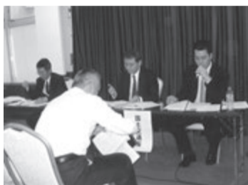
国交省の説明会が各地で

関西人はすぐに「入って何かトクすることがあるの」と言いつつも、業界周辺の近代化への流れの早さの中で参入への意識が高まっているのも事実です。国の考えは全国にある民間賃貸住宅数1340万戸の有効活用です。民間借家のオーナーが管理業者に管理を委託。