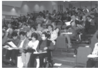
会場はオーナーでぎっしり

「ハートピア京都」を会場に開催。階段状のホールは見易いことでオーナーさんにも好評でした。一般的な話より経営に直接結びついたことが知りたかったという昨今のオーナーさん。