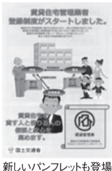
新しいパンフレットも登場

賃貸住宅管理業者や、住宅を借り上げて転貸するサブリース業を対象に行う任意制度。昨年9月に告示公布。同12月1日に施行。制度を所轄するのは国土交通省。近畿ブロック各支部の登録業者数