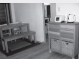
木が生かされている内部

「付近との調和と木と土のよさを意識させた」再生工事に自信たっぷりでした。同事業の仕組みは町家の所有者が管理信託会社と委託契約を結び、京都府不動産コンサルティング協会がプロデューサー。今後は賃貸され、その賃料で融資金は返済され、やがて京町家は所有者に返還されます。昨年末に調印式が行われ、今年3月に工事完了となりました。施工は「HABBITA 京匠」です。