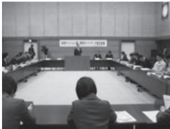
県警本部での設立総会

滋賀県は京都、大阪のベッドタウンとして発展する一方、多くの大学が立地しています。そのため一人住まいの若い女性が多いことから、性犯罪を防止し、犯罪被害に巻き込まれるのを防ぐと、情報ネットワークを立ち上げた。警察と女性マンションを繋ぐ情報ネットワークの構築は全国でも初