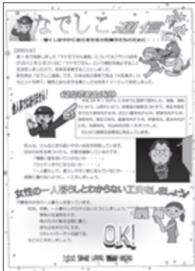
防犯チラシの「なでしこ通信」

滋賀県警は滋賀県内のマンションを管理する日管協滋賀支部や大学生協京都事業連合などに協力を求めて、警察とマンションを繋ぐネットワークが実現しました。県警本部が毎月、防犯