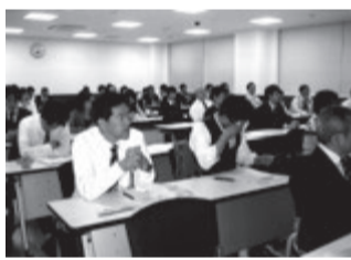
研修する大阪府支部会員