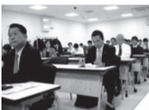
関西で行われた登録制度についての説明会

ルールをクリアできている「事業者」という判断です。日管協の近畿ブロックに属する各支部でも「登録制度」への加入へ向つてい 同制度の普及は最終的には国交省が求めるレベルの高い管理が行われることで貸主・借主の利益が保護されることに到達します。業務の標準化によって各地で起きている紛争、クレーム解消へも役割を果たすこととなります。国交省が主導して進行中の登録制度は業界の健全化ともなるわけで管理会社登録が急がれます。