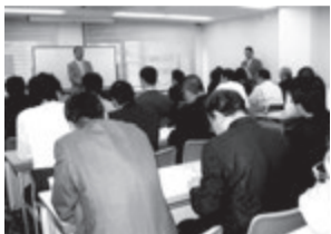
相談員研修会の会場

相談員研修開く 4月26日、京都市の「すまいよろず相談」のうち、賃貸部門の相談を担当する日管協京都府支部と京都府不動産コンサルティング協会が市民のためにさらに充実した場となるよう「相談員研修会」を開きました。京都市側も出席、相談実績からの傾向と、京都市の住宅政策についても知る機会になりました。