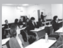
熱心に聞く女性参加者

インテリア分野に入る「照明」。質の高い賃貸住宅空間の提供が求められている今、関係者にとっては興味のある新分野です。レディース部会では賃貸住宅におけるインテリアへの注目度が増す中で特に「光」を取り上げ、照明を専門とする「コイズミ照明」から二名の講師を迎えて照明の効果と電気代を安くするLEDについての講演会を開催しました。