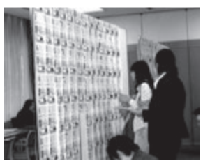
住宅フェアの会場

今回を機に、イベント方式を変え人も地域も対象をワイドにしようという企画です。ネットを利用して世界の各地からいつでもどこからでも住宅を発見できるアクセスを完成させようというものです。これまでの展示方式からポータルサイトを利用して、日管協と交流協会が協力して秋頃にはシステム完成の見通しです。より便利により多くの物件を各国から即アクセスできるのも時代の要請で新しい仕組みの完成、発表に期待がかかります。(詳しくは次号で)。