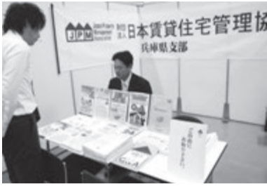
神戸支部の出展ブース

兵庫県支部は4月24日、神戸市中央区の神戸国際展示場コンベンションセンターで開催された全国賃貸住宅新聞社主催の「賃貸住宅ミニフェア2012イン神戸」に出展。日管協兵庫支部の存在を地域の賃貸住宅オーナーや住宅関連産業などにアピールしました。