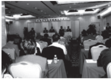
活気あふれるセミナー会場