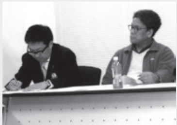
各委員より意見が続出。ユニークな活動テーマが次々と出ました

●積極的な情報交換 ●視察見学会の実施 ●活動目標の明確化 ●組織の認知度向上などが出てきました。組織の運営では、イベント時の集客力の増加を。事業面では優良管理会社の紹介や視察。他社のノウハウを知る機会を増やす。会員にとってプラスになる交流の場を持つ。講演なども同じ講師の繰り返しなどマンネリ化がみられるとし、他分野の人までが興味を持てる選定が望ましいーなどです。