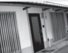
外周りのデザイン