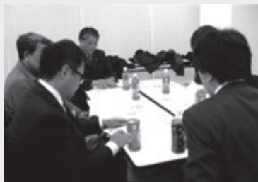
運営委員による活発な意見交換