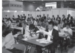
満員のセミナー会場