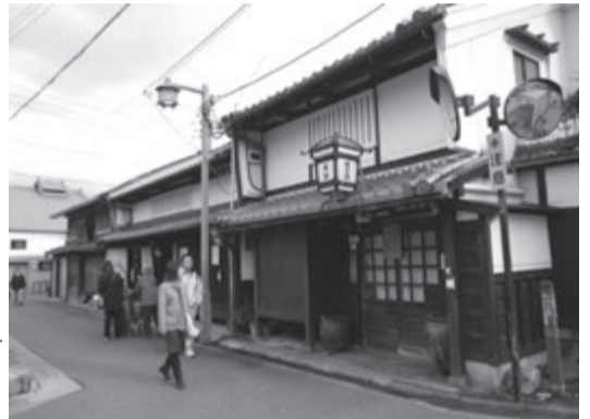
伝統の景観伝えるならまちな町家

奈良県内の伝統的な町家は、奈良市内のならまち、きたまちや橿原市の今井町、桜井市の三輪など県下の8市1町の11カ所に集積し、貴重な歴史的景観を伝えています。ところが、最近では建物の老朽化などによって、空き家が目立つようになり、空気が増えると、町の活力が失われ、建物の傷みが進み、景観の維持も難しくなります。また、防火の心配など治安上の心配もあります。