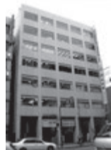
京都府支部の新事務所(2F)