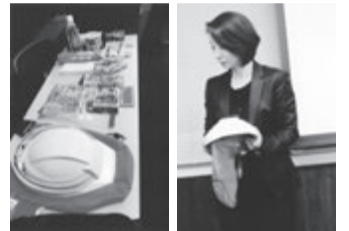
会場で公開された防災グッズ

震災リスクをテーマに「ディスカッション」(大阪府支部) 実行事例や、考える力、引き出す場に 研修「震災」における対策を議論 大きな震災を2度も経験した後、管理業界は改めて災害時の対処能力について考えさせられました。大阪府支部では今回、グループディスカッション形式の研修で震災リスク全般について再度スポットを当てました。管理会社の災害対応は備えの充実、役割の認識、被災地からの学びと、議論は続きました。