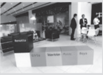
社屋のユニークさも参考に(金沢)