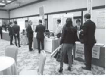
「日管協フォーラム」は勉強の場でした

仕組みの空き家解消」をテーマに京都の住宅統計を示しつつ空き家の原因と背景を説明。各種の改修の成功の事例を明らかにすることで来場者には活用方法のヒントになりました。 マンスリーマンション、シェアハウス、町家再生、新しい手法を次々と公開。ビジネスチャンスの好機会とし、成功例を示しつつの話はさすが。「不動産からまちづくり業」へ経験実践からの内容は好評でした。