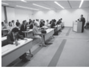
台風の影響を受けた兵庫県支部のセミナー