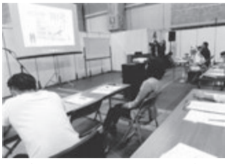
独自性あふれるレディース部会の講演会場