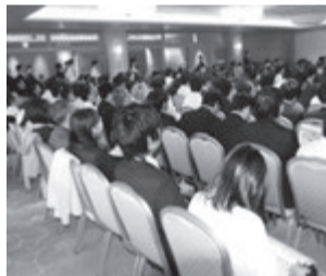
立見席も出た会場

すが会場は立見の状況。さらにIT重説、新しい人材育成、紛争、民泊、シェアリング、PR方法、リノベ、全てが気になります。前回よりテーマ毎にレベルの向上、掘り下げがみられました。来場者は5時間の配分に苦心したようです。各分野の魅力あるゲストが登場するのもフォーラムの特徴です。近畿ブロック各支部長の顔も。