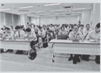
参加者であふれる会場(大阪)

このところ近畿ブロックの各支部で「ベンチマーク」が盛んです。参加者も増える一方。理由は日頃から関心のある他社を知り、経営の参考にしたいという発想です。この動き、当分続きそうです。なぜ関心があるのかをまとめてみました。