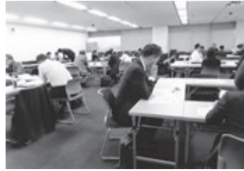
グループ別に集まって議論