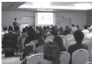
人でいっぱいフォーラム会場

急がれる「登録住宅」の確保 国土交通省は新たな「住宅セーフティネット制度」の実施へ本格スタート。入居に配慮を要する民間賃貸住宅を主軸にした「登録住宅」の確保が急がれます。