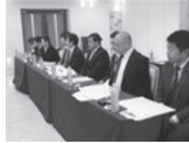
ブロック会議に参加した和歌山県支部の新会員

支部会員が10社も新加入した和歌山県支部。東支部長は「今後は会員のメリットは何だと問われる。日管協がどんな組織か、どんな活動をしているかを実際に見てもらうことが重要」。