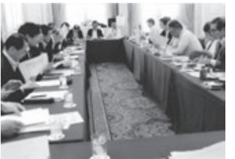
盛り上がる幹事会

総務委員会がリードする「オーナーセミナー」です。来場者の多いセミナーには力が入るの当然で、日管協本部から事務局担当者や会長が加わり、副会長も来阪して講演。視野を広げた企画を連続させ、日管協の知名度向上へ役立っています。