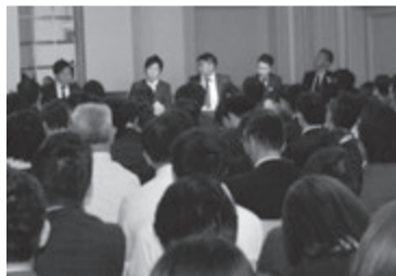
場内で各支部との人事交流も

研修、交流、楽しみ、内容充実して 日管協が主催、全国から来場者が集まるという大イベント「日管協フォーラム2017」が11月14日(火)東京都港区の明治記念館で行われました。全国から3,304人、近畿ブロックから61社151人が参加しました。「賃貸業界の今と未来がわかる ビジネスチャンス発見」と全国から多くの人が集まりました。近畿ブロックの各支部からも参加。5時間という短い時間の中で得るものはたくさんありました。 全体構成は①委員会・研究会セミナー②実行委員会セミナー③協賛企業セミナーに分かれ、参加者は5時間を有効に使おうと研修項目を選びつつ場内を激しく移動していました。「5時間では足りません、2日間にしては」などの声も聞きました。それほど聴きたい知りた項目が多く、その気持ちもわかるほどでした。