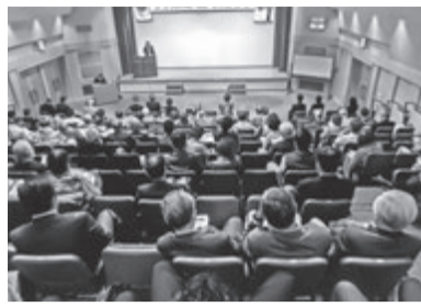
満員のセミナー会場

京都府支部主催の「オーナーセミナー」は毎回、地元重視のテーマと徹底しています。国の後援の基に行われる全国規模のイベントですが、国の施策である「安心・安全・住環境の向上」と致していればその地域の特性が生かされてよい内容でという考えです。