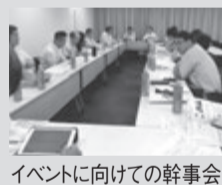
イベントに向けての幹事会

月13日14日。後援 国土交通省、大阪府、協力 全国賃貸住宅新聞社。会場「インテックス大阪」。