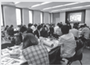
留学生対象のイベントも多い。(フラットエージェンシー主催)

飲食店や宿泊施設に再生。その現地を見学し、宿泊もして実感してもらおうとの企画です。フラットエージェンシーの