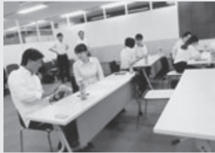
留学生雇用への機会づくり(株)長栄

飲食店や宿泊施設に再生。その現地を見学し、宿泊もして実感してもらおうとの企画です。フラットエージェンシーの