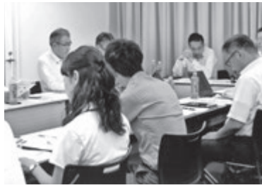
大阪府支部でも研究会を早速開催

〒642-0001 和歌山県海南市船尾 241-8 木地由ビル 1F (株)ホームズ内) TEL.073-482-3739 FAX.073-482-9777 E-mail.kogire@homes-homes.jp