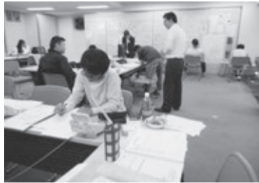
熊本地震でボランティアを行う兵庫県支部の会員