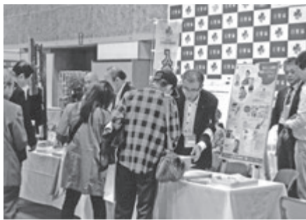
日管協ブースへオーナーなど幅広い来場者が