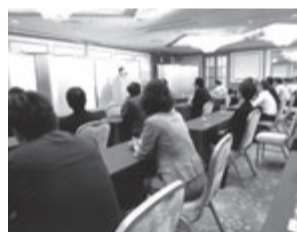
次々開かれる研修会も満員 (大阪のおばちゃんが講師)

京都府支部の28年度後半のスケジュールは多種多様です。予定していた「成果発表大会」を取り止め「オーナーセミナー」を中心に大小のイベントが続きます。東京都支部レディーズ委員会と合同で企画の「ベンチマークin京都」は首都圏の中心支部との共催が注目され、支部活動が「一気に全国から注目されます。」