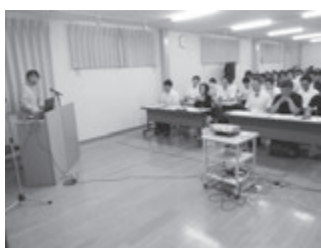
滋賀県支部の第1回研修会