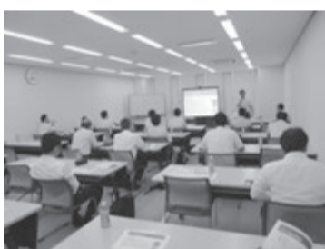
兵庫県支部の第2回研修会

第4回日管協近畿ブロック懇親ゴルフコンペは10月19日、大津市の瀬田ゴルフコース西コースで開催。滋賀県支部主管さんら10組40人が参加します。