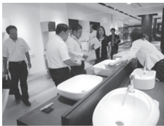
奈良県支部の見学会

奈良県支部は7月29日、大阪市北区のグランフロント大阪内の「サンワカンパニー」大阪ショールームを見学しました。支部会員10社15人が参加しました。