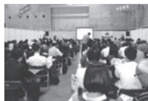
前回のセミナー会場 会場はいつも人でいっぱい

多彩な企画と演出が毎回楽しめる大阪府支部が主催する「オーナーセミナー」正式名称「住環境向上セミナー」。今回は2016年の開催として前年よりさらに内容を充実させた研修講演、座談会を予定しています。支部別動員数でもトップを行くだけに今回も2日間開催の利点を生かして500人以上の動員を予定。来場者増につながる充実の企画と演出が毎回楽しめる大阪府支部が主催する「オーナーセミナー」正式名称「住環境向上セミナー」。今回は2016年の開催として前年よりさらに内容を充実させた研修講演、座談会を予定しています。支部別動員数でもトップを行くだけに今回も2日間開催の利点を生かして500人以上の動員を予定。来場者増につながる充実の企画と演出が毎回楽しめる大阪府支部が主催する「オーナーセミナー」正式名称「住環境向上セミナー」。