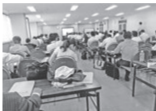
関係業者で満員の会場