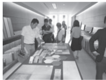
建築材料も豊富に揃えている