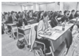
必死にメモをしていました