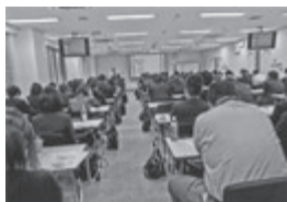
会場は若手社員で溢れそう

男女の若手社員が約1000名。地元大阪以外、京都、滋賀、兵庫の各地域から新人、若手社員が集まり、終日勉強「色」。「賃貸管理業界で仕事をするためにまず基本を」と決心し学ぶために参加した若者と、会場は終始熱い雰囲気でした。