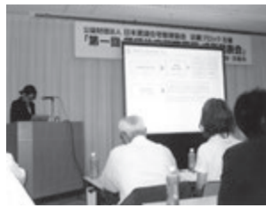
第1回成果大会での発表