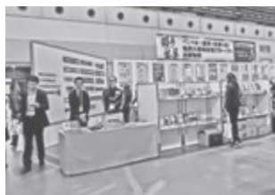
賃貸住宅フェア会場(前回)