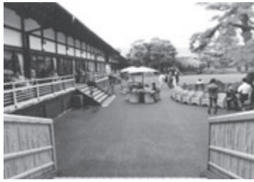
会場の明治記念館内部

毎年6月に行われる会員総会。来賓の国交省から賃貸管理業にまつわる行政の動向が報告されます。民泊問題など当面の問題や、賃貸管理業法施行への見通し、また、賃貸不動産経営管理士の国家資格化実現への進捗状況の説明が期