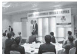
来賓の門川大作京都市長が挨拶