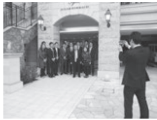
「イグレック南本町」のエントランスでの記念撮影