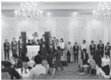
大阪府支部の総会会場

大阪府支部は日管協近畿ブロック6支部の中で会員数一位の113社が加わる組織。それだけにその活動ぶりは全国から注目。社員が主役という成果大会の獨創性。オーナーセミナーにおける来場者数全国一など組織活動で好結果を出しています。さて、今年度のニュー大阪府支部は。近畿のトップをいく会員数のパワーによってと