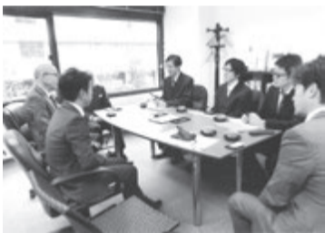
議論する会議参加者

自動車の駐車場の区画を貸し借りするに際しての仲介契約について、宅建業法の適用があるかどうか時折質問を受けることがあります。国土交通省などの解釈では、駐車場契約の仲介は宅建業法の規制対象行為ではないとされています。宅建業法は、宅地建物の売買・交換・賃貸借の契約についての仲介行為を規制対象としています。しかるところ、駐車場の区画を貸し借りする契約は、法的性質から判断して、土地の賃貸借契約ではないと解釈されており、宅建業法の規制が及ばない契約であるとして取り扱われております。したがって、駐車場を貸し借りすることを宅建業者が仲介する場合でも、重要事項の説明業務はありません。また、その仲介手数料についても宅建業法の報酬規制も適用ありません。宅建業者が駐車場契約を仲介する場合の仲介報酬は、暴利にわたらない範囲で宅建業法の規制によることなく当事者の合意で定めることができます。