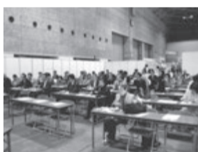
前回のオーナーセミナー会場はいつも人であふれます

664名もが日管協大阪府支部のブースやセミナー会場へ来場しました。これは昨年全国で同時期に開いた「オーナーセミナー」の支部別入場者数でトップの数字。(参加者664名、資料配布879セット)。今年秋の「オーナーセミナー」2016ではこれを上回る参加者を迎えようというテーマの選定は慎重です。毎回、時代をとらえ、また、次代を予測したセミナーや研修を行い、そのすべてが満員となり、それらの経験が新企画への自信へとつながっています。最大の目的は「日管協のイベントに参加すると何かを知り、変わり、ビジネスの参考へつなげる。関係法律の理解や人材教育の問題点までを知る貴重な機会」という声もありました。その反応に後押しされた新企画に期待です。特に前回目立ったのは会場内の「日管協ブース」への