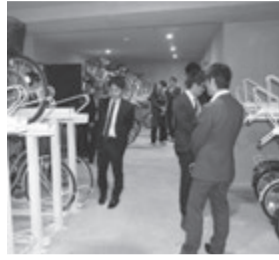
1階には100台分の駐輪場