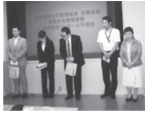
京都で開催時の予選会