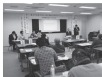
偏見と無知が問題と議論

滋賀県居住支援協議会が後援するシンポジウム「精神障害者の住宅事情」が3月25日、大津市浜大津の「明日都」内ふ