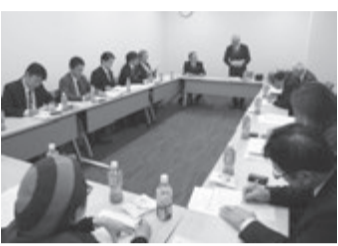
意見交換が行われる近畿ブロック幹事会

前年比上回る動員を 本部事業として実施。国 が後援する「住宅環境向上 セミナー」も前年比を上回 る動員を課題に10月11 月に近畿の各支部で行 います。会員増につながる 催しとして重要な位置付 けです。その他、賃貸住宅 管理業者登録制度の推進、 賃貸不動産経営管理士試 験の講習などが行われます。 「入会しないと今後の管理 業務推進は困難」と思わせ る活動内容です。