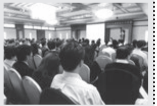
若い人の参加が目立つのも特徴です

お国ことばが行き交う会場の熱気はヒートアップ。たった一日で知りたいことを吸収しようと参加者はみんな必死。各会場は補助椅子も出る盛況です。やはり新鮮さと、知りたい、参考にしたいことが各会場で次々と発表されるからでしょう。