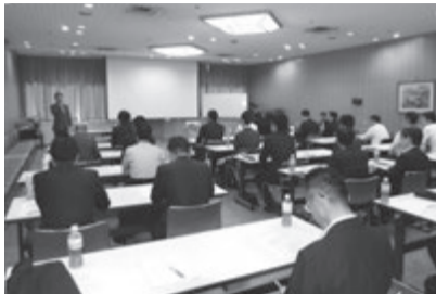
兵庫県支部総会(5月12日)

近畿ブロック4県支部は5月にそれぞれ支部総会を開催し、役員人事や支部運営計画などを報告したほか、各支部の新会員を紹介しました。