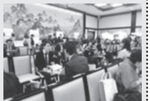
会場はどこも人で溢れています(前回)

今年も秋が深まった頃に開催される「日管協フォーラム2016」。賃貸管理業をめぐる未来と現在をしっかりと知る絶好の機会です。今回で4回目を迎え、主催する日管協も回を重ねる毎に工夫を加えています。業界関係者はこのイベントに何を求めているのかを直視、大都市から地方までの関心事を分析し、取り入れて次々とテーマにしてみました。