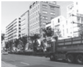
安全な京都の街へ マンションの防犯を徹底

民が協力して防犯犯罪防 止への取組みが積極的だ。 今回の認定制度は防犯 設備の専門家をつくる NPO法人京都府防犯設 備士協会(京都市山科区) が認定。京都府警、京都府 京都市が推奨し、日管協京 都府支部も京都府建築士 会と共に協力団体として