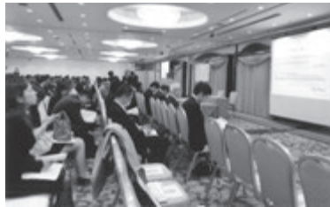
前回の日管協フォーラム会場

特徴は、明日の管理業のあり方を体で感じてもらえる現実路線。つまり、セミナーも成果発表も新鮮そのものです。テーマに沿った講師も経験豊か、いま仕事の中心で活躍し