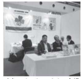
昨年のオーナーセミナー会場(日管協のブース)

大阪府支部のブースを設けて各種のデータを揃え、来場者へ説明するなど「日管協の存在アピールの基地」とします。本部から講師も派遣され、業界の方向性や管理の専門性について講演。事務局からの応援もあるなど、万全の体制で臨みます。