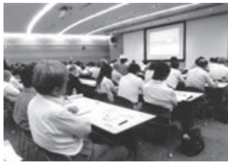
推進事業説明会会場 会場は満員でした

大阪府と市、OSAKA あんしん住まい推進協議会、大阪の住まい活性化プログラムが主催した「住宅確保要配慮者あしん居住推進事業」の説明会がこのほど大阪市内で行われました。今春発足した推進協を軸にすでに活動を開始、今回は各関係者や組織が集まって具体的な事業内容の推進を確認しました。