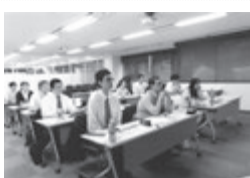
留学生 熱心に受講

学生が順に自己 紹介。自在に日 本語を使って不 動産業について質 問するなど真剣 そのものでした。 午後は荻野政