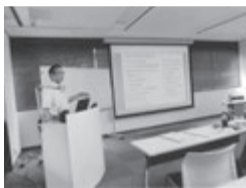
賃貸管理業をグローバルな 産業に。それには外国の方 の参加が…(熱が入る研修