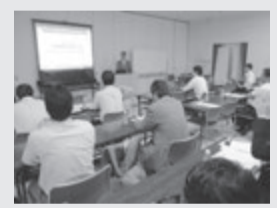
「重説IT化」を解説、兵庫県支部第1回研修会

第2部では日管協相談窓口に寄せられた相談事例を総合研究所研究員が解説する動画を上映。