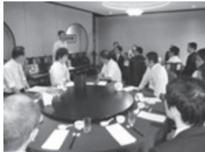
相続支援コンサルタント 上級者の会発足会

の交流、組織化が模索され、東京ではすでに発足済みでした。この日は食事しながら各自のコンサルタント業務の体験を披露したほか、会の運営方針などを話し