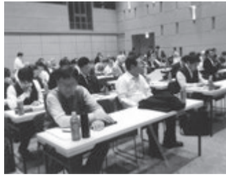
家族信託の講演に期待大です

今回の主テーマは「形」と題して司法書士がオーナーが強い関心をもつ「相続対策」で、その中でも注目の「家族信託」について、願いが叶う!思いが実る!「家族信託による新しい相続と財産管理の」も注目のテーマです。当日は講演以外に京都市など行政から都市政策の進捗への協力についての報告、また、賃貸初の「防犯マンシヨン認定制度」についても説明があります。セミナーは午後1時30分から開始です。