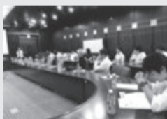
男性も女性も参加して研修