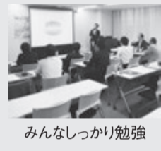
みんなしっかり勉強