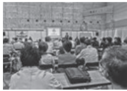
前回のセミナー会場(大阪)

国交省が国の「住宅月間」と決め、全国規模で開催するイベント。名称を前記のように変えたのは、賃貸住宅の居住環境を向上させるにはオーナーから管理会社、一般入居者まで幅