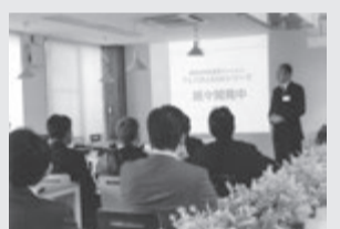
参加者で溢れる近畿ブロック大阪府支部の研修

入会への問い合わせは8面の近畿ブロック各支部の事務局へ。また、(公財)日本賃貸住宅管理協会・東京都中央区八重洲2-1-5東京駅前ビル8階TEL.03-6265-1555。