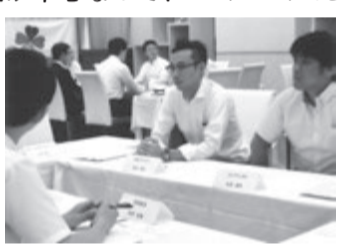
「管理の実務は各社で対処が違うので」…フーン

2部はグループディスカッションです。8つのテーブルに5~6名の社員がテーマ別に座りこの会が目的とする「他社から学ぶ」を基本に自由討論。悩みや成功経験、失敗事例、提案、難問題などをテーブル上で公開し、教えたり、教えられたりして時間はアツという間に過ぎました。業務に関する問題が中心なので、日頃から実務で苦労したり、よい方法の選択過程だったり、成功実績の披露もあって各テーブルは激しいやり取り。各席のリーダーが進行の責任となって進めました。「時間が足りない」「となりのテーブル