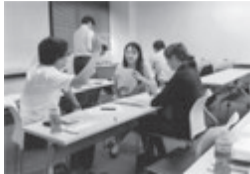
日本語のマスターが大事…と

学生が順に自己 紹介。自在に日 本語を使って不 動産業について質 問するなど真剣 そのものでした。 午後は荻野政