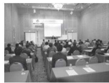
昨年の奈良県支部のオーナーセミナー

毎秋恒例のオーナーセミナーが今年も今月と来月に開催されます(別表参照)。日管協近畿ブロックの4県支部は和歌山県支部が