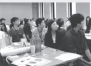
アジア系が目立った留学生

(株)フラットエージェンシーがセミナー 留学生のみなさん「就職の受け入れ体制は十分です」