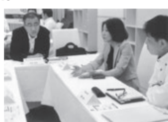
「難問題はこうして解決」などと

最後の懇親会では白熱の研修を終えて、早くノドを潤したいと思う参加者。また、この機会を通じて親しく接したい気になるあの人と名刺交換をしたりと。すべてに若く前向きなイベントでした。